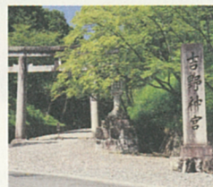
吉野神社 後醍醐天皇を祀る総検校の建物です。