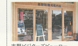
吉野ビクターズビューロー 1階は観光案内所です。お土産購入やレンタサイクルも出来ます。