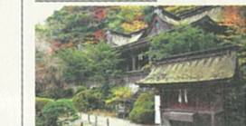
吉野水分神社(よしのみづりじんじや)