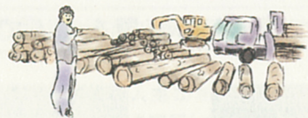
吉野町木に沢山並ぶ立派な木 原木の日に、活気のいい鉄道の声!!