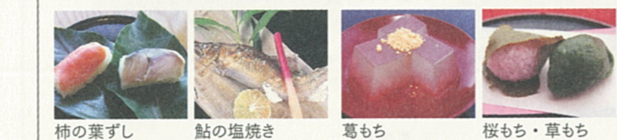
柿の葉ずし 鮎の塩焼き 葛もち 桜もち・草もち