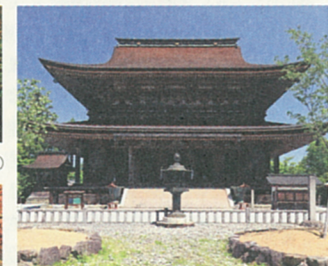
金峯山寺蔵王堂 東大寺大仏殿に次ぐ木造の大建築であり国宝に指定されています。